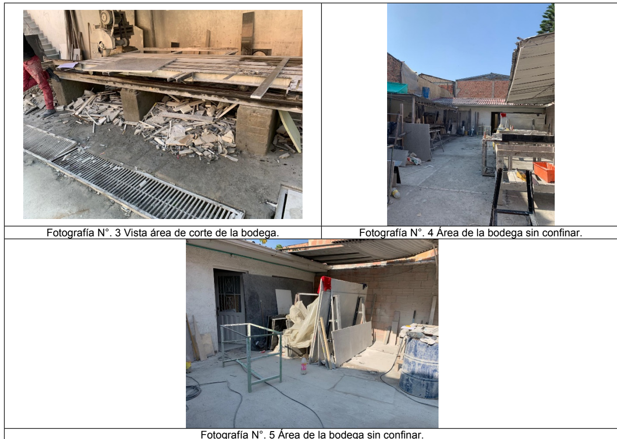
Fotografía N°. 3 Vista área de corte de la bodega.